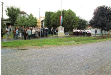
Az ünneplő közönség