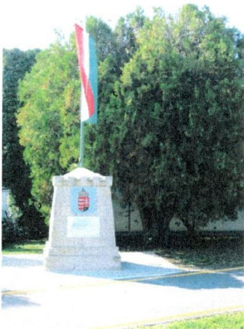
A felújított Országzászló.