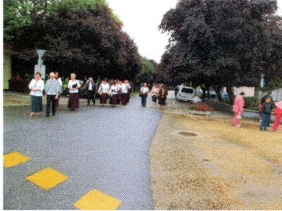
A vendégek vonulása