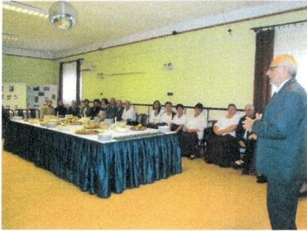
A Polgármester köszönti a vendégeket.

4115 Ártánd, Templom utca 3. 0630 326 47 15 ; 0654 431 710/17 zamtiborkonyvtar@freemail.hu