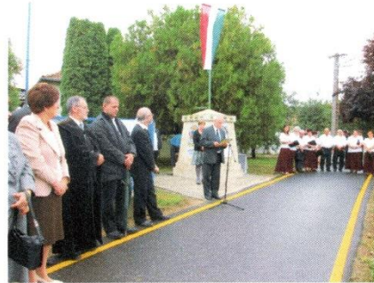
A Polgármester beszédet mond