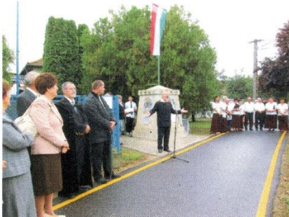
Meleg Vilmos színművész verscsokrot ad elő